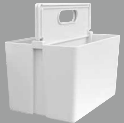
Regular : 240×160×152.5mm