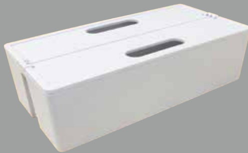
L : 320×160×92.5mm